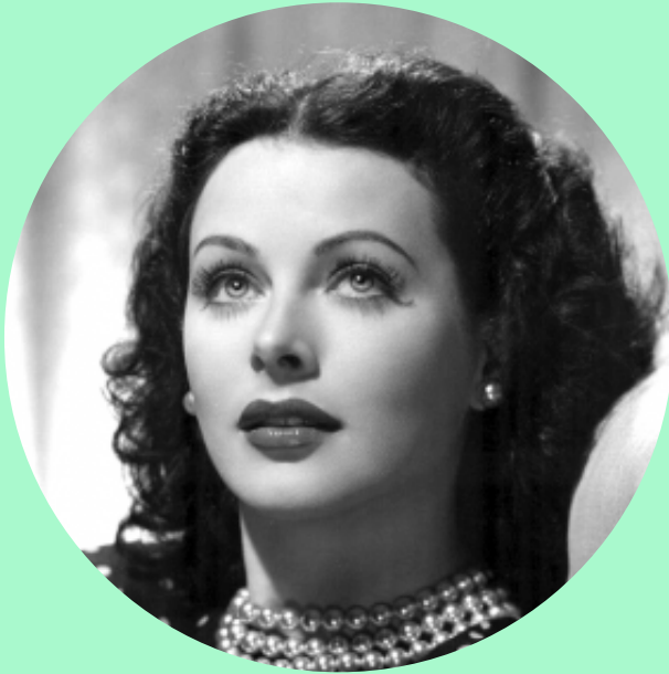
HEDY LAMARR (1914-2000)

NÉE EN AUTRICHE, HEDY LAMARR INVENTA LA TECHNOLOGIE SANS-FIL EN 1942 LORS DE LA DEUXIÈME GUERRE MONDIALE ALORS QU'ELLE VIVAIT AUX ÉTATS-UNIS 1 . ELLE EUT L'IDÉE LORSQUE LES TORPILLES AMÉRICAINES N'ATTEIGNAIENT JAMAIS LEUR CIBLE, CAR ELLES ÉTAIENT DÉTECTÉES PAR L'ENNEMI 1 .